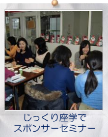
じっくり座学でスポンサーセミナー