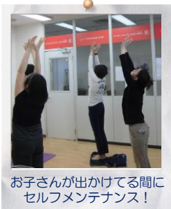
おさんが出かけてる間にセルフメンテナンス！