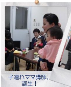
子連れママ講師、誕生！