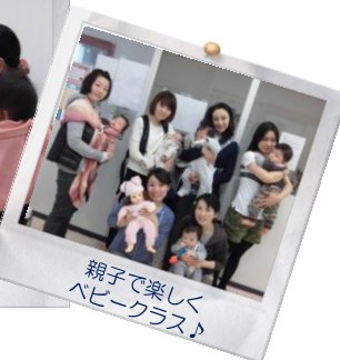
親子で楽しくベビークラス♪

これまで“輝く私”ステーションでは、仕事や子育て、その両立に悩む方へのカウンセリングや講座のほか、「女性のキャリア支援」や「乳幼児親子が楽しめる」などをテーマにした各種ワークショップを開催してきました。最近では、少しずつですが、パパの来館も増えています。これからも“きっと、もっと輝く私”を応援していきます!!