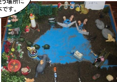
↑「やってみよう！箱庭」では、親子で箱庭づくりに挑戦してもらいました。

まず物を全部出してみても過去1年間使っていないものは処分。使う物は使う場所にしまうのが基本です。