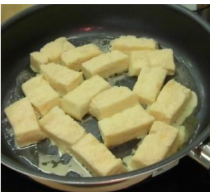
↑キャラメルシナモンをたっぷり使ったフレンチトーストの実演